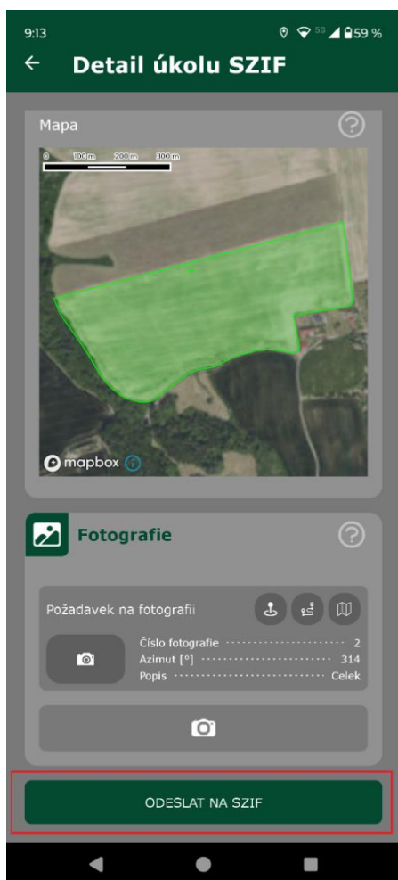
Obrázek č. 3: Tlačítko pro odeslání úkolu.

V případě, že není povolené oprávnění Odesílání úkolů na SZIF na mobilním zařízení, tak není možné splněné úkoly odeslat na SZIF přímo z terénu. Úkoly je možné bez tohoto oprávnění v terénu pouze synchronizovat s Portálem GTFoto, kde je možné je následně odeslat na SZIF. Na Obrázku č. 1 vlevo je zvýrazněno tlačítko pro odeslání splněného úkolu na SZIF. Na Obrázku č. 2 vpravo je zobrazena chybová hláška, pokud není oprávnění odesílání úkolů na SZIF na daném mobilním zařízení povoleno.